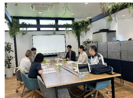
<R5 事業者交流会の様子>

【対象】「清流の国ぎふ」SDGs推進ネットワーク会員、ぎふSDGs推進パートナー