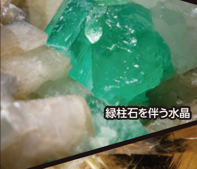
緑柱石を伴う水晶