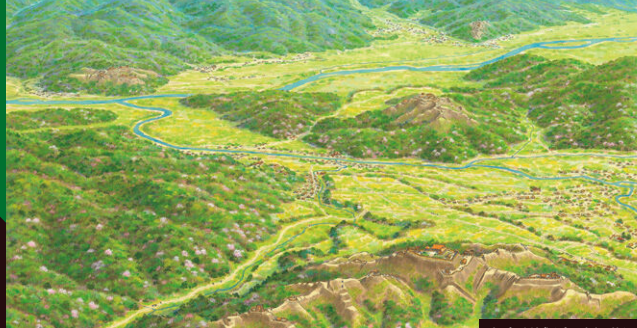
小鷹利城(向氏段階)