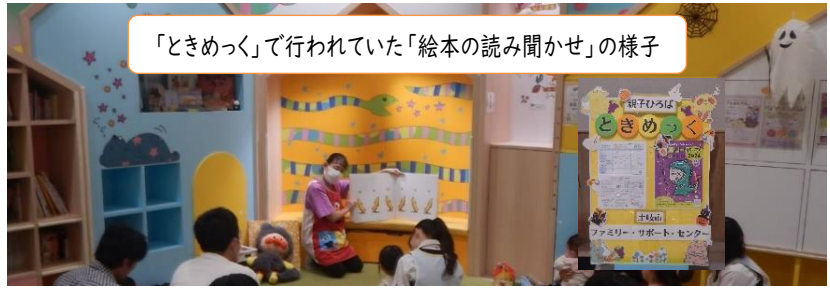
「ときめっく」で行われていた「絵本の読み聞かせ」の様子

土岐市子育て応援イベント「ファミリーベース」は、イオンモール土岐と土岐市の主催で行われたもので、土岐市子育て応援施設「ときめっく」の運営を土岐市から委託されているNPO法人ママズカフェの企画・運営により開催されました。