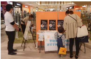
土岐市子育て情報×ブルーシールコラボ 子育て情報・園給食のレシピ紹介