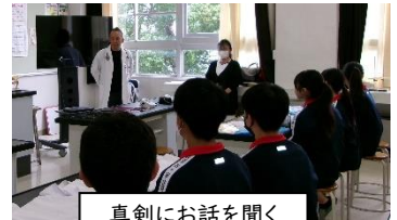
真剣にお話を聞く

「きみたちの自己紹介を聞いていて、学ぶという熱意が感じられてとてもうれしいです。また、今こうして話を聞く姿勢を見ていても、一人一人が今、何でここにいるのかとしっかり自覚していると感じます。」と学ぶ姿勢を賞賛してみえました。