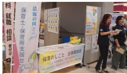
岐阜県保育士・保育所支援センター (土岐市・多治見市・瑞浪市) 保育の仕事を目指す方にお仕事紹介です