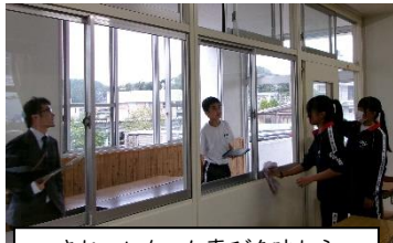
きれいになった喜びを味わう