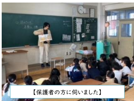
【保護者の方に伺いました】

毎年、読み聞かせボランティアを行っています。「お母さんの読み聞かせ、おもしろいね。」とわが子の友だちが言ってくれたそうです。ちょっとハードルがあがってしまいましたが、絵本選びから頑張りました。