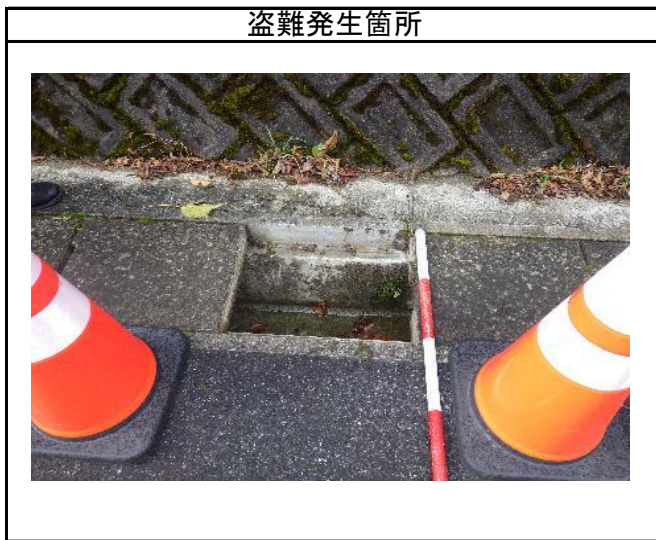
近景(グレーチング蓋が設置されていた箇所)