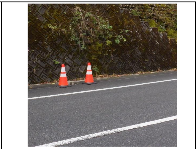
東から西へ向かって撮影