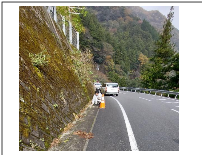
南から北へ向かって撮影