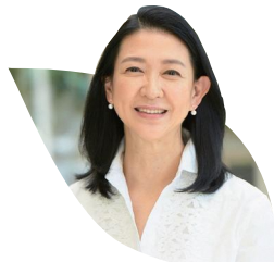
こんのみさこ 紺野 美沙子 氏 俳優・朗読座主宰

東京都出身。夫の両親が岐阜県郡上市出身。1980年、NHK連続テレビ小説『虹を織る』のヒロイン役で人気を博す。俳優として活躍する傍ら、UND P親善大使としても活動中。2010年秋から「紺野美沙子の朗読座」を主宰。NHK-FM『音楽遊覧飛行』案内役を担当。元祖スー女としても知られ横綱審議委員である。2016年1月岐阜県図書館名誉館長に就任。アウトリーチ事業として、岐阜県図書館以外に、近年では各務原市（2023年）、揖斐川町（2024年）などで朗読会を開催している。