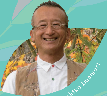
今森光彦氏 写真家・切り絵作家