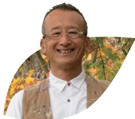
いまもり みつひこ 今森 光彦 氏 写真家・切り絵作家

1954年、滋賀県出身。琵琶湖をのぞむ田園風景の中にアトリエを構え活動する。自然と人との関わりを「里山」という空間概念で追い続ける。一方、熱帯雨林から砂漠まで、地球上の辺境地の取材を続けている。写真集に『里山物語』（新潮社）、『湖辺』（世界文化社）、『世界昆虫記』（福音館書店）、写真文集に『萌木の国』（世界文化社）、『里山を歩こう』（岩波書店）、写真絵本に『神様の階段』（借成社）など著書多数。木村伊兵衛写真賞、土門拳賞、毎日出版文化賞、小学館児童出版文化賞、産経児童出版文化賞大賞など数多くの賞を受賞。