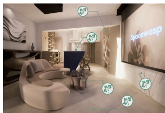
▲植物から生まれる内装空間

植物廃棄物から内装空間材を構築・提供する。自動で空間を作れる仕組みと、何度も作り変えることができる循環型内装で、未来の内装インフラを創出し、新たな内装空間を提供する。