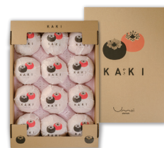
▲独自基準で厳選した 「Umai KAKI 富有」