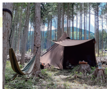
▲人工林の空間を活用

キャンパー向け森林レンタルサービス「フォレント」をはじめ、木材生産以外の森林の新たな活用による価値向上に通ずる取り組みや、環境問題・ウェルビー