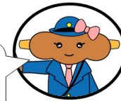
中津川警察署公認キャラクター たれみちゃん

みぎさんの安全安心な暮らしにつながる情報を配信していきます。チャンネル登録よろしくお願ひします！