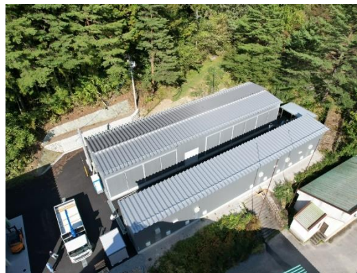
木材乾燥施設 (高山市)