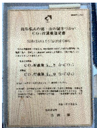
CO 2 貯蔵量認定証(非住宅)

・ 県産材を使用した非住宅建築物4件、一般住宅124件で計1,185.9CO 2 -tonのCO 2 貯蔵量を認定し、ホームページで公表しました。