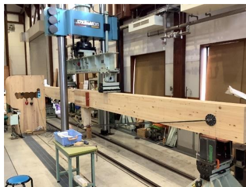
構造部材の強度試験