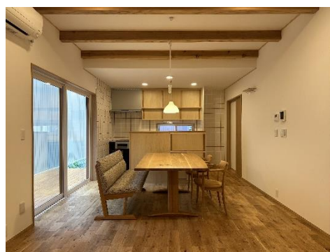
県産材を使用した住宅