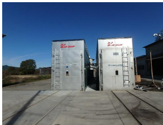
木材加工流通施設(乾燥施設)の整備 (恵那市)