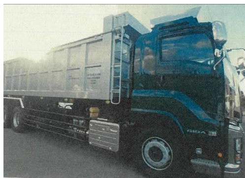
未利用間伐材搬入用トラック (美濃加茂市)