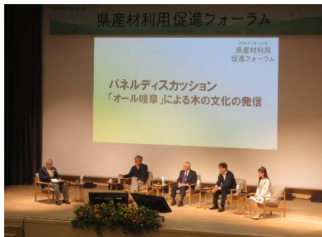
県産材利用促進フォーラム

・「ぎふ木遊館」の累計入館者数は52,716人となったほか、71名のぎふ木育サポーターの登録を行いました。また、ぎふ木育教室と緑と水の子ども会議に延べ7,033人の参加がありました。