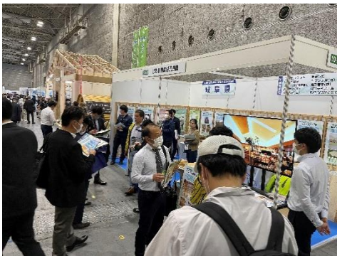
非住宅木造建築フェア(大阪市)