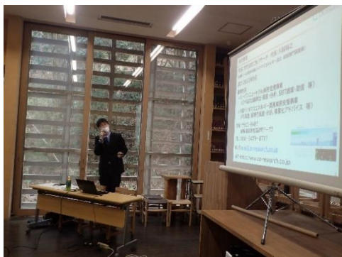
木質バイオマス利用アドバイザーによる研修会 (美濃市)