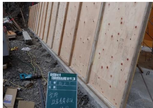
治山工事での県産材型枠 (揖斐川町)