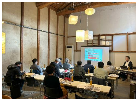
木造建築マイスター養成講座