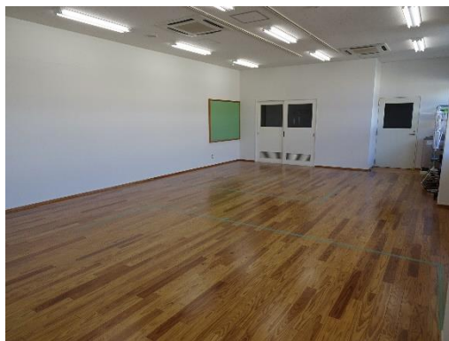
西濃高等特別支援学校 多目的室