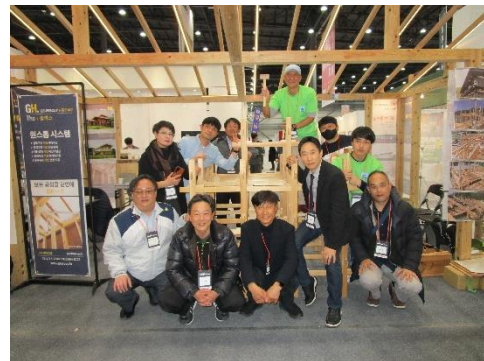
スウォンギョンヒャンハウジングフェア(韓国)