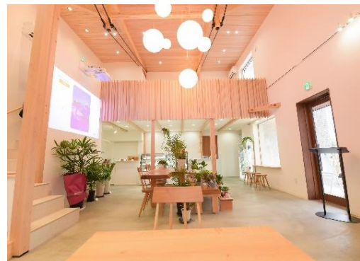
喫茶店・特産品販売施設（高山市）