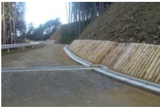
林道工事の丸太伏工 (中津川市)