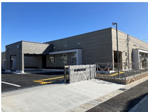
大垣市立ひまわり学園（大垣市）