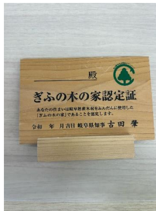
CO 2 貯蔵量認定証(住宅)