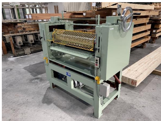
ラミナ両面糊付け機 (中津川市)

・品質が確かな建築用木材の供給につながる、製材工場や木材乾燥施設などの施設整備等6件に対して経費の一部を支援しました。