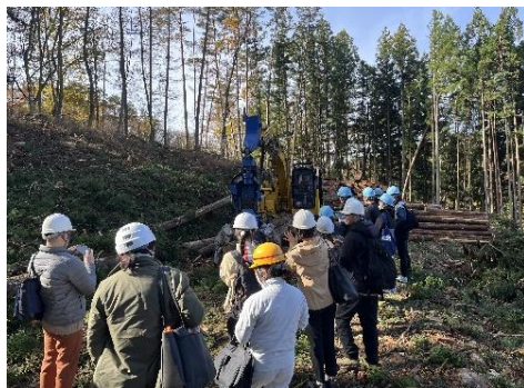
木造住宅アドバイザー養成講座

・非住宅建築物への県産材の利用を促進するため、経験豊富な建築士を対象とした木造建築マイスター養成講座を開催し、新たに13名の岐阜県木造建築マイスターを登録しました。