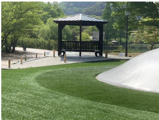
四阿（ぎふワールド・ローズガーデン）

・ 県と県内6市町村（関市、中津川市、郡上市、下呂市、白川町、東白川村）が提供し、「東京2020オリ・パラ競技大会選手村ビレッジプラザ」で使用された後、返還された木材を再利用したベンチ・東屋・遊具等を製作し、「ぎふ木遊館」などPR効果の高い7施設に導入しました。