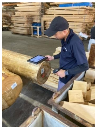
製材前の原木登録作業 (下呂市)