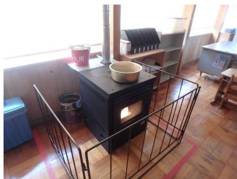
木質ペレットストーブ (高山市立北小学校)

・教育施設、福祉施設等8施設において、木質ペレットストーブ（12台）、薪ストーブ（7台）の導入を支援しました。