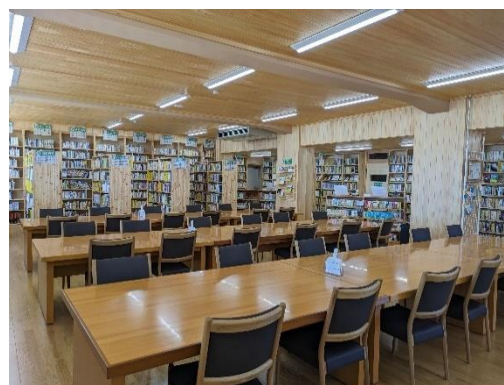
岐阜北高等学校 図書館