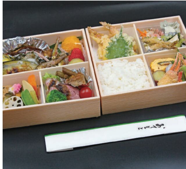
天然鮎の塩焼きや飛騨牛のローストビーフなど岐阜の味が堪能できる「鵜飼御膳(5,000円 ※税込)」は品数も多くボリューム満点。鵜飼観覧のお供に。

昭和元年創業の「うを義」は度々メディアでも紹介されている老舗の割烹料理店で、夏は郡上の天然鮎を会席料理や弁当などで楽しめます。コース料理では塩焼き、魚田、天婦羅、フライといった焼物や揚物から、甘露煮、背ごし、うるか、雑炊など、色々な味が堪能できます。また鵜飼観覧船での食事には塩焼きや魚田の入ったお弁当もあります。腰蓑(こしみの)をまとう鵜匠に見立てた「鮎の鵜匠揚げ」や鮎の炊き込みご飯を握った「鮎まんま」などの創作料理もおすすめです。