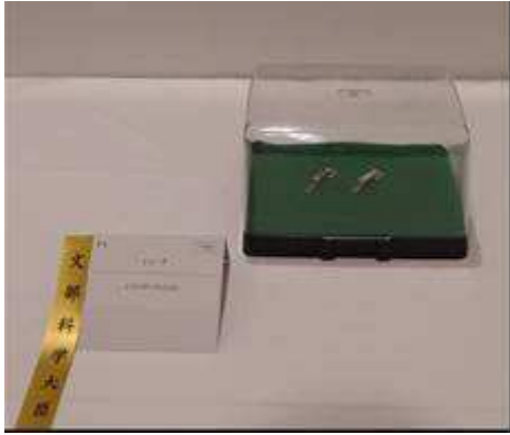
『ヒューズ』 太平洋精工株式会社