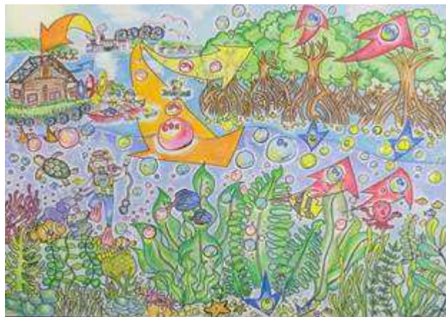
『未来を繋ぐカーボンリサイクル可能な海』