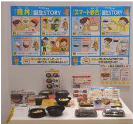
『中身を守る食品容器のヒミツ』 リスパック株式会社