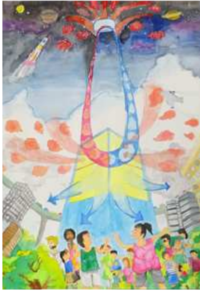
『地球温暖化対応エアコン』