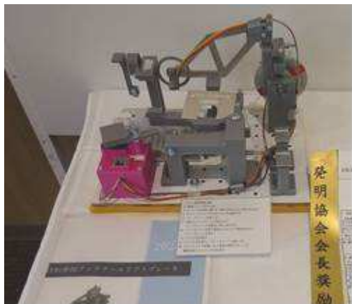
『自転車用アンチテールリフトブレーキ (ATLB)』 私立多治見西高等学校 2年 やぎゆう たいと 柳生 泰杜