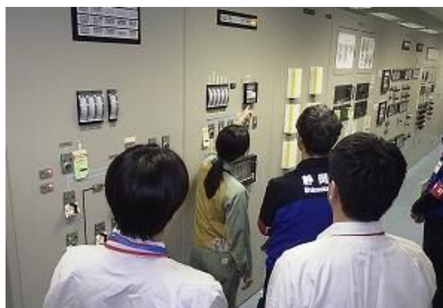
耐震補強を施した記録計を点検している様子

注1 自主的に取り組んできた重大事故対策や、2013年7月に施行された原子力規制委員会の新規制基準を踏まえ追加した対策工事などのことです。