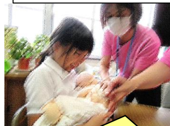
赤ちゃんって、小さくてやわらかい!