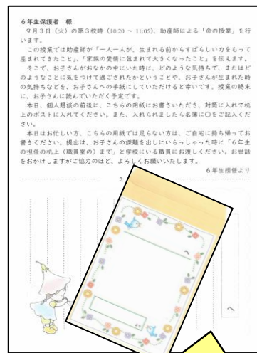
6年生の保護者には、我が子が生まれた時の様子や気持ちを手紙に書いてもらい、授業の最後にサプライズで子どもたちに渡しました。