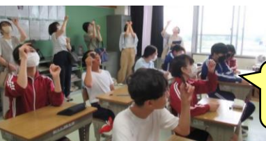
6年生 針で穴をあけた画用紙をのぞき、受精卵の大きさを実感します。