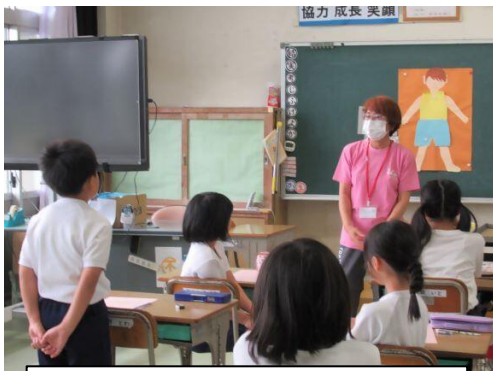
4年生は、思春期のからだの変化について学びました。