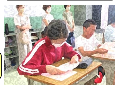
こんなに小さな卵がおなかの中で赤ちゃんになるって信じられない!いのちってすごい!