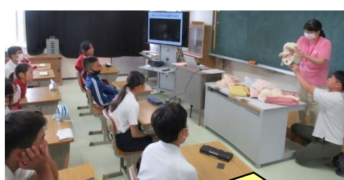
赤ちゃんはどのように生まれてくるのかな。