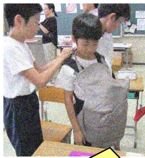
赤ちゃんがおなかにいると大変だね。