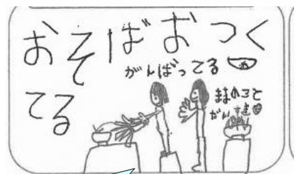
こんなかわいい絵もありました。