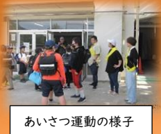
あいさつ運動の様子

取組期間 令和6年5月7日(火)～5月12日(日) 参加者 全校児童親子 児童数 157名 (115世帯)