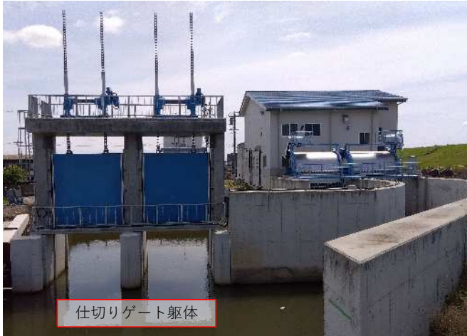
仕切りゲート躯体