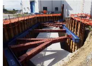
接続水路 (施工状況)