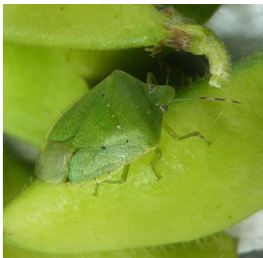
ミナミアオカメムシ (成虫) (体長 12-16mm)