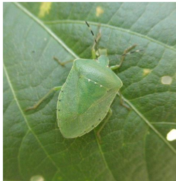
アオクサカメムシ (成虫) (体長 12-16mm)