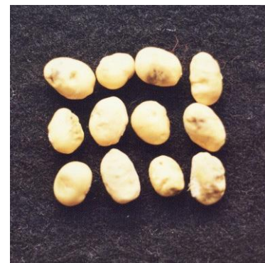
吸実性カメムシ類による被害粒