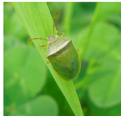
イチモンジカメムシ (成虫) (体長 9-11mm)