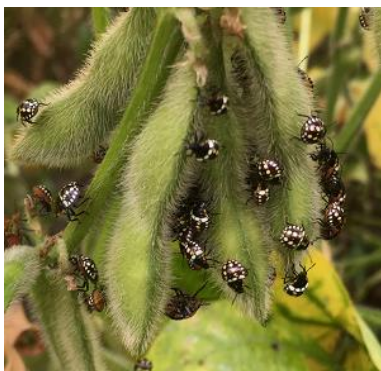
莢に群がる幼虫 (ミナミアオカメムシ)