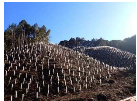
<再造林と幼齢木の保護>