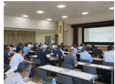
<市町村林務担当職員研修>