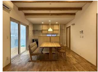
<県産材を使用した住宅>