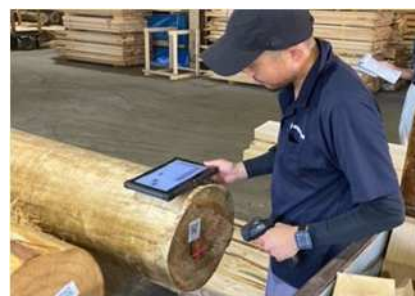
<製材前の原木登録作業>