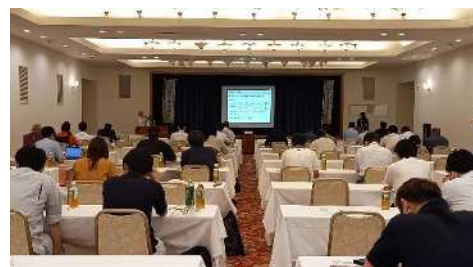
<ぎふ清流GAPきこの取組拡大研修会>