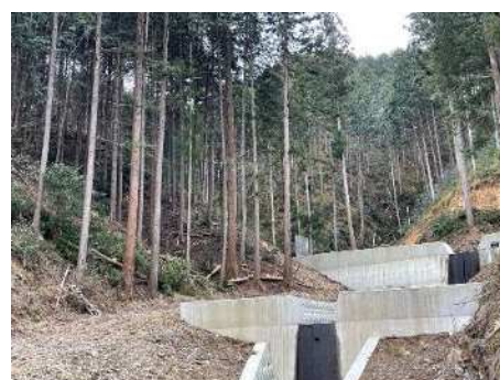
<森林整備と治山施設を組み合わせた事業地>