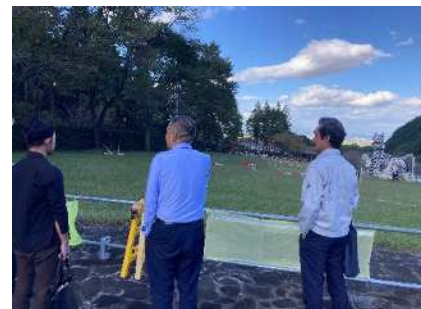
<プランナーの派遣>