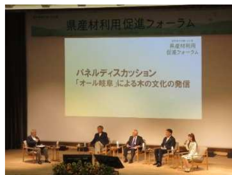
＜岐阜県木の国・山の国県産材利用促進フォーラム＞