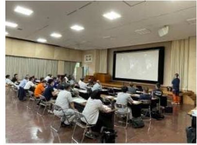
<未利用材搬出促進安全研修会>