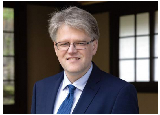
オーレリウス・ジーカス駐日特命全権大使