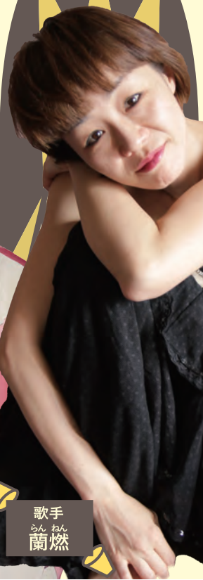
歌手 らん ねん 蘭 燃