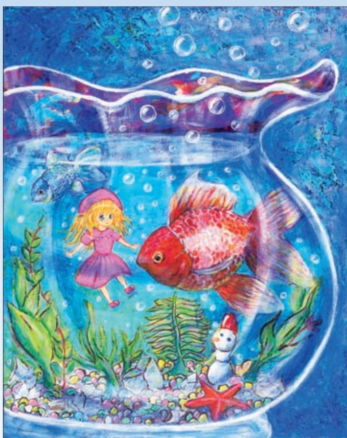
ふれあいアートステーション・ぎふ登録作品 令和5年度知事賞作品