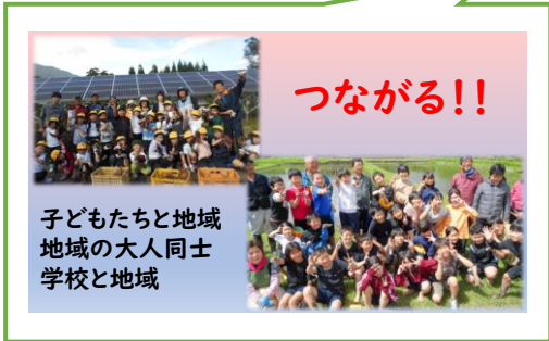
子どもたちと地域 地域の大人同士 学校と地域

「できる人が」「できる時に」「ゆるく」「楽しく」行う 大中小学校の地域学校協働活動