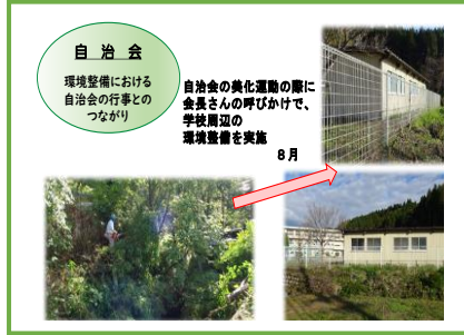
自治会 環境整備における自治会の行事とのつながり 自治会の美化運動の際に会長さんの呼びかけで、学校周辺の環境整備を実施 8月