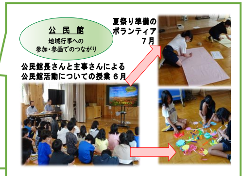
公民館 地域行事への参加・参画でのつながり 夏祭り準備のボランティア 7月 公民館長さんと主事さんによる公民館活動についての授業 6月