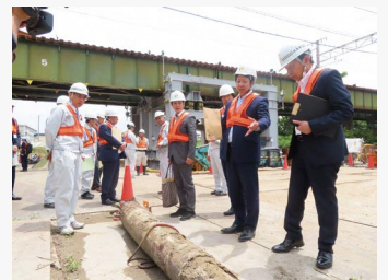
境川河川改修を視察

交通渋滞の緩和や、産業振興の推進と災害時に有効に機能する道路ネットワークの確保を目的とした橋梁の整備など、道路、河川、県営水道、都市公園などの現状と課題について調査しました。