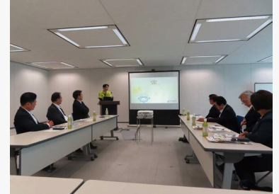
大垣市情報工房 デジタルひろばを視察

大垣市のデジタル推進拠点施設「大垣市情報工房 デジタルひろば」、障がい者の職業的自立を支援する「イビデンオアシス(株)」、垂井町が旧庁舎跡地に整備したにぎわい創出施設「ワイワイプラザ垂井」の取組について調査しました。