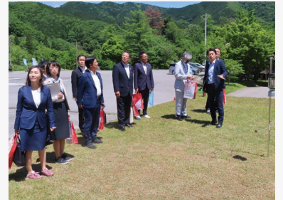
揖斐高原キャンピングフィールド AFUREPPA を視察

森の中でのアクティビティが楽しめる「揖斐高原キャンピングフィールド AFUREPPA」、飼料コストの削減に取り組み、粗飼料自給率100%を実現した「(有)千洋牧場」、就労継続支援A型B型多機能型事業所「それいゆ」を運営する「(株)DAI」の取組を調査しました。