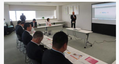
ぎふマリッジサポートセンターを視察

独身者の出会いや結婚に関するサポートを行う「ぎふマリッジサポートセンター」、令和5年2月に新衛生センターが竣工した「南濃衛生施設利用事務組合 衛生センター」、令和5年10月に新築オープンした「岐阜・西濃医療センター 西濃厚生病院」の取組について調査しました。