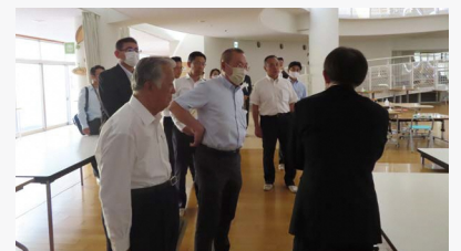
岐阜希望が丘特別支援学校を視察

治安警備、災害警備等の任務にあたる機動隊の現状や、令和6年4月に開校した不登校生徒の教育を行う北方町立北学園特例教室「オンリー1」、肢体不自由児への教育支援を行う岐阜希望が丘特別支援学校の取組について調査しました。