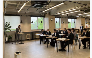
OKB岐阜大学プラザを視察

産学連携オープンイノベーション拠点「OKB岐阜大学プラザ」、サプリメントなどカプセルタイプの健康食品の受託生産を行う「中日本カプセル(株)」、家庭用高級美容機器の開発・製造・販売を行う「(株)A. GLOBAL」の取組について調査しました。