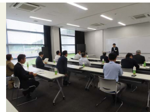
岐阜かかみがはら航空宇宙博物館を視察

将来の航空宇宙産業を担う人材の育成を目指し、教育プログラムを提供する「岐阜かかみがはら航空宇宙博物館」、農的関係人口の創出や移住につなげることを目的とした農泊プランを行う「GIFU-DO農泊」を視察しました。