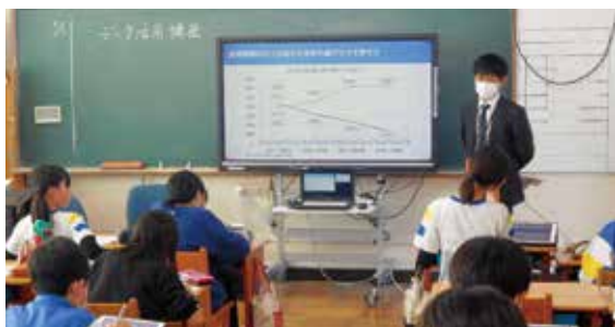
令和5年11月 高山市立西小学校5年生のみなさんと