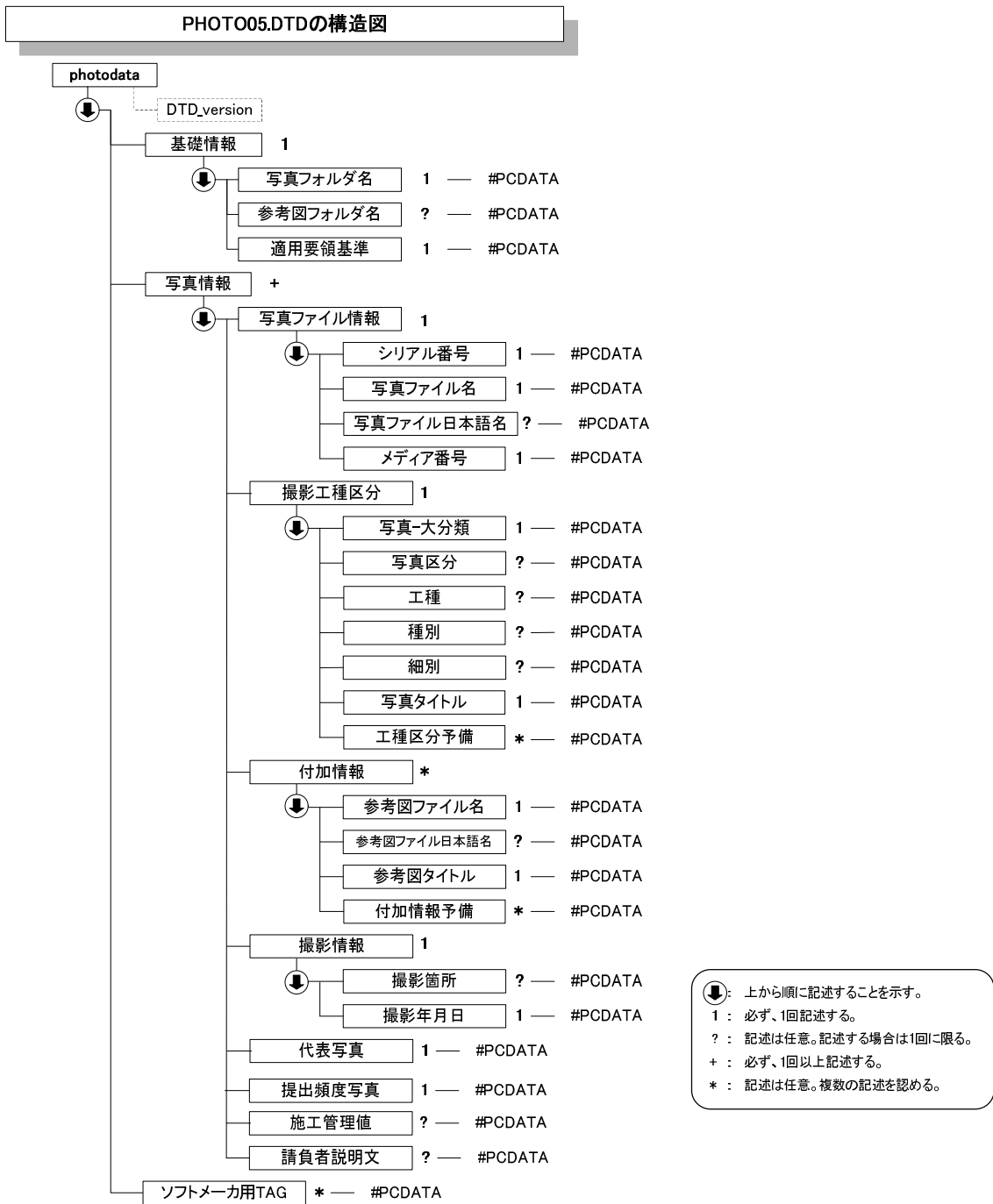
図付 1-1 写真管理ファイルの DTD の構造