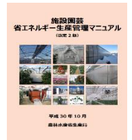
▲省エネマニュアル