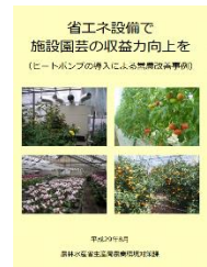
▲省エネで収益力向上を