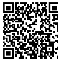
▲省エネ通知のページQRコード