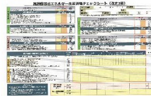
▲省エネチェックシート