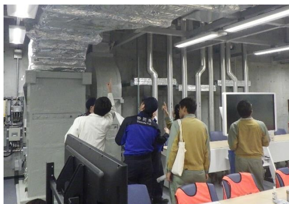
緊急時対策所内に設置した火災感知設備を点検している様子

注1 自主的に取り組んできた重大事故対策や、2013年7月に施行された原子力規制委員会の新規制基準を踏まえ追加した対策工事などのことです。