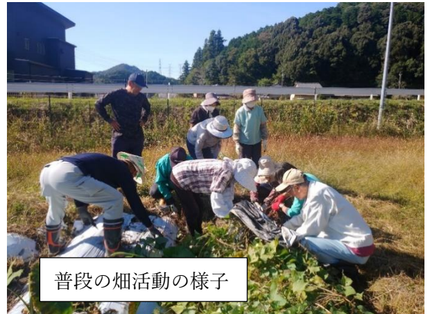
普段の畑活動の様子