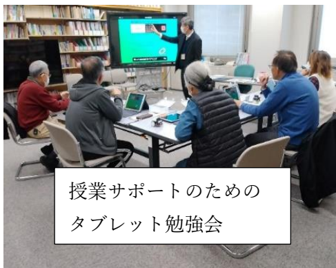
授業サポートのための タブレット勉強会