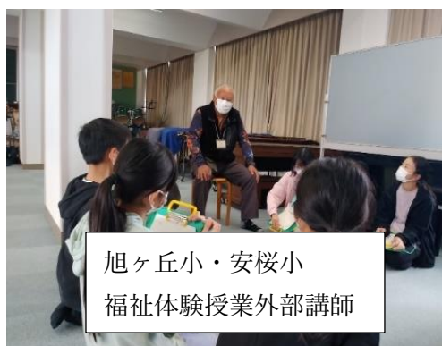
旭ヶ丘小・安桜小 福祉体験授業外部講師