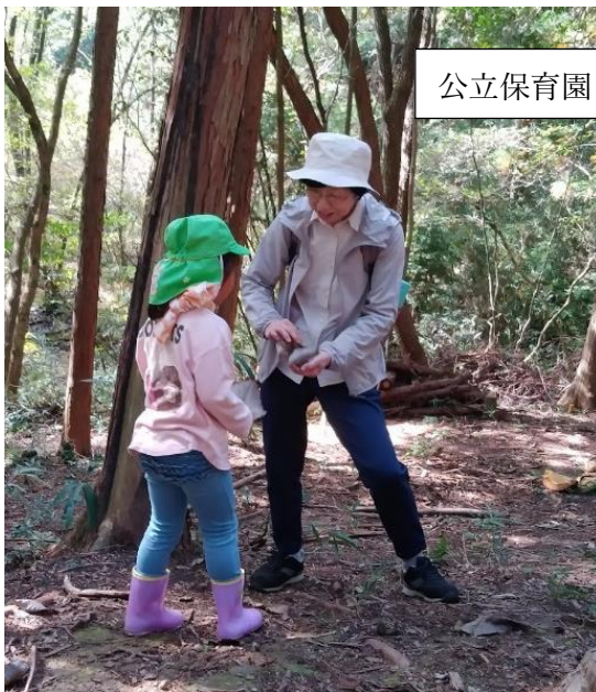
公立保育園・森のようちえんサポート