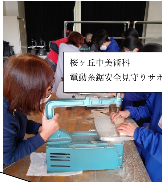
桜ヶ丘中美術科 電動糸鋸安全見守りサポート