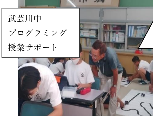
武芸川中 プログラミング 授業サポート