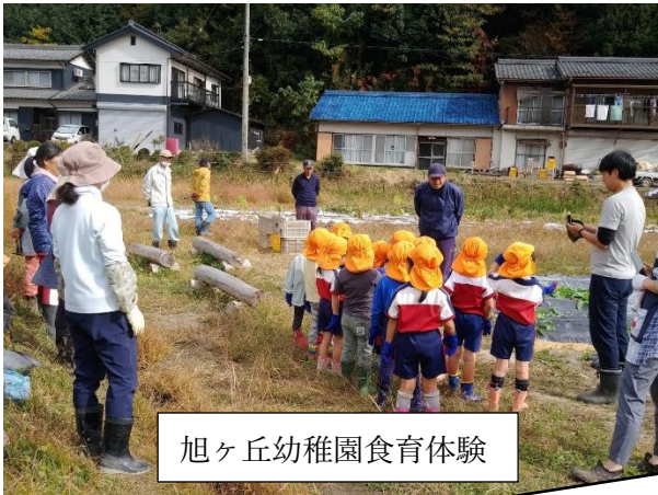
旭ヶ丘幼稚園食育体験