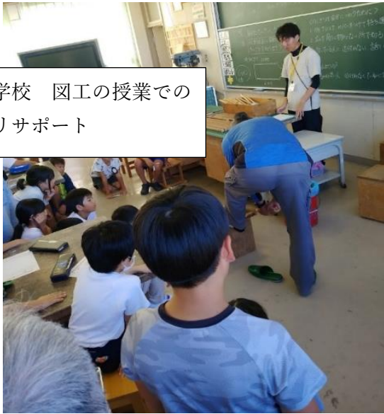
倉知小学校 図工の授業での ノコギリサポート