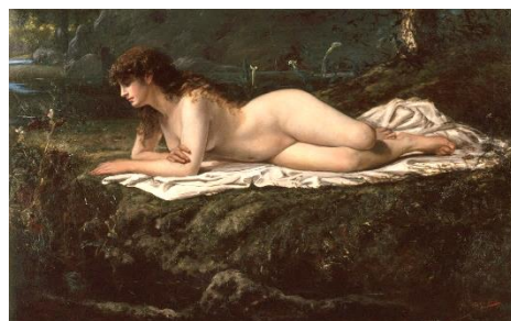
山本芳翠《裸婦》1880年頃 岐阜県美術館収蔵 【重要文化財】