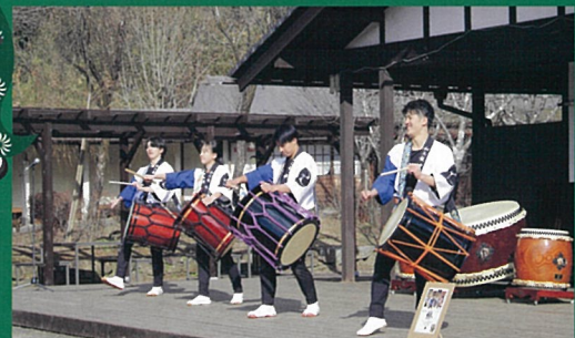
1/3(水) 櫻 11:00 / 14:00