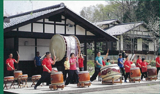
1/2(火) 牧野太鼓 11:00 / 14:00