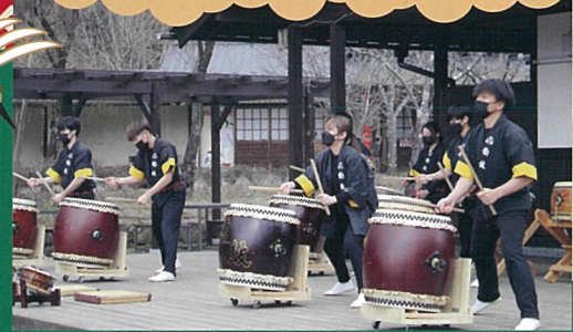
1/1(月) 龍鼓 11:00 / 14:00