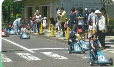
ゴーカート貸し出し

足踏式ゴーカートや自転車で遊びながら、交通知識や正しい交通マナーが覚えられます。 ミニチュア都市には、車道、歩道、信号機、標識、踏切、横断歩道、遊具等があります。自転車、小学生用ゴーカート、幼児用ゴーカート無料貸し出しがあります。