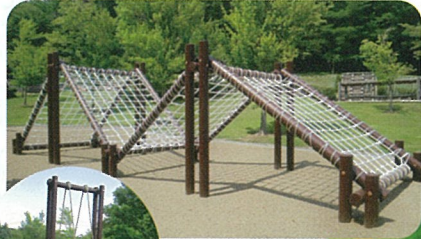
アスレチック遊具

子どもたちが全身を使って楽しく遊び、体力づくりをすることができるアスレチック遊具がある広場です。 ネットラダー、忍者渡り、丸太ブリッジなど