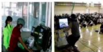
(実際の体験講座の様子)

自転車を運転する際に起こりうる危険を体験することで、危機予測能力や安全意識の向上を図ります。