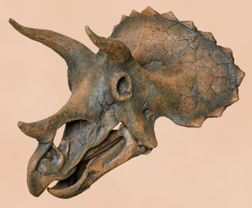
角竜類の恐竜 トリケラトプスの頭骨標本