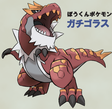
ぼうくんポケモン ガチゴラス