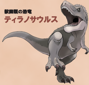
獣脚類の恐竜 ティラノサウルス