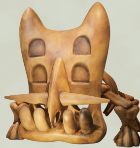
シールドポケモン トリデプスの骨格想像模型

「カセキポケモン」の実物大骨格想像模型が登場! 古生物の標本と、ポケモンの実物大骨格想像模型を比べてみよう!