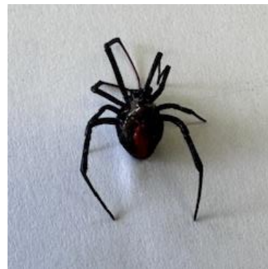
セアカゴケグモ 成体 (胴体6mm)