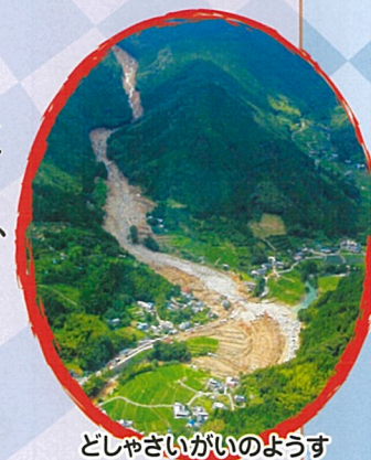
どしゃさいがいのようす

これまでの入賞作品は国土交通省砂防部Webサイトで見ることができます。 https://www.mlit.go.jp/mizukokudo/sabo/kaiga_sakubun.html