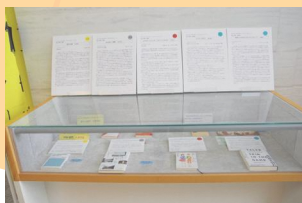
令和5年度 入賞作品展示 ■場所 岐阜県図書館 ロビー