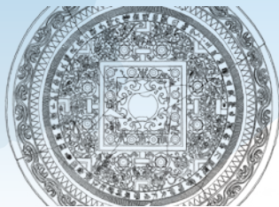
方格規矩四神鏡 (「美濃観音寺山古墳」美濃市報告より)