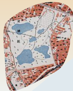
1万分の1地形図「中野」 (「戦時改描図論考」海青社より)

日本のどこかの地域の80~100年くらい前の地理について知りたいとき、私たちはまず当時の地形図を探すのではないのでしょうか。でも、せっかく見つけた地形図の内容にウソ、偽りが含まれていたとしたら……「戦時改描図」と呼ばれるそうした地形図に騙されないよう、実例をご覧いただきながら基本的なことからについてお話しします。 ※「岐阜県古地図文化研究会 地図講演会」を兼ねています。