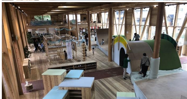
写真:KAKAMIGAHARA PARK BRIDGE