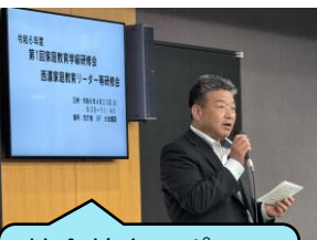
社会教育スポーツ課長の挨拶