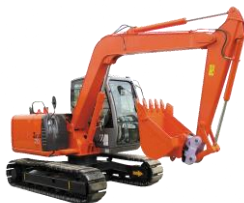
車両系建設機械(整地等)