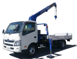
小型移動式クレーン