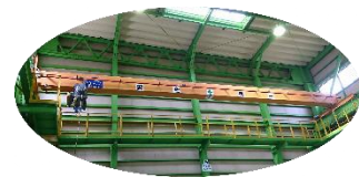
床上操作式クレーン