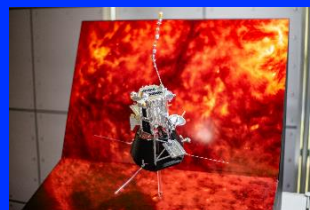
優秀賞 太陽探査機「Parker Solar Probe」