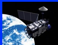
月周回衛星 かぐや