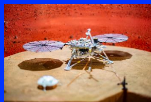
最優秀賞 火星探査機「Insight」