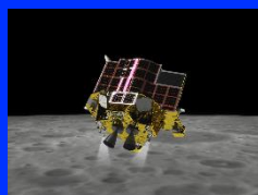
小型月着陸実証機 SLIM