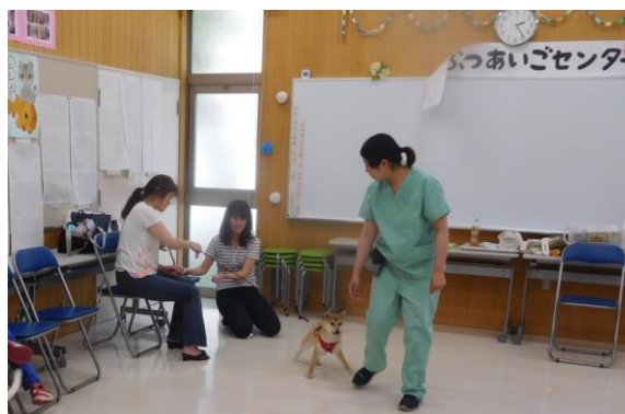
しつけ方教室の様子