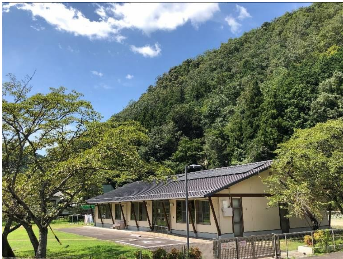
動物愛護センター外観

※ 動物愛護センター職員は、野生鳥獣リハビリセンターを主管する環境生活部 環境政策生活課を兼務