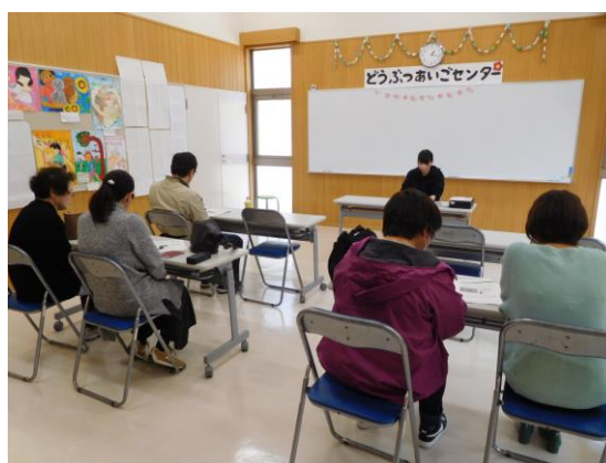
譲渡前講習会の様子