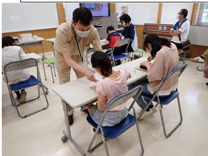
動物のお医者さん体験