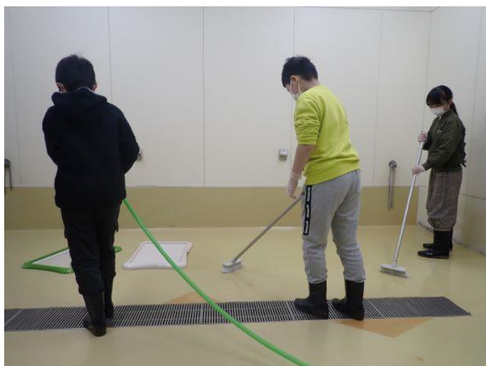
愛護センターのお仕事体験教室