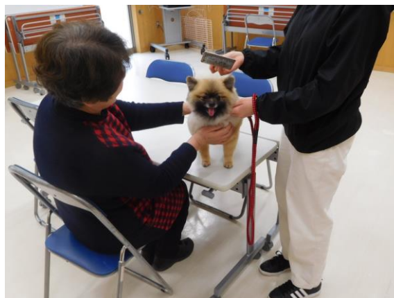
犬の飼い方・しつけ方個別相談の様子