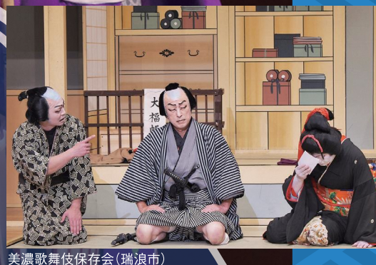
美濃歌舞伎保存会（瑞浪市）

第39回国民文化祭 第24回全国障害者芸術・文化祭 「清流の国ぎふ」文化祭2024