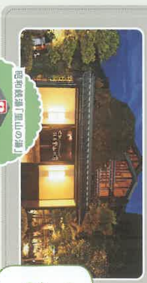
昭和銭湯「里山の湯」