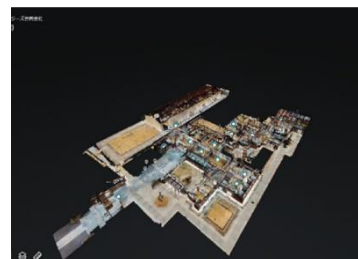
ドールハウス (3Dモデル)

ドローンで撮影した映像を公開しており、通常は見る事ができない視点から、高山陣屋を見ることができます。