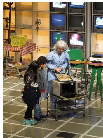
サイエンスショー