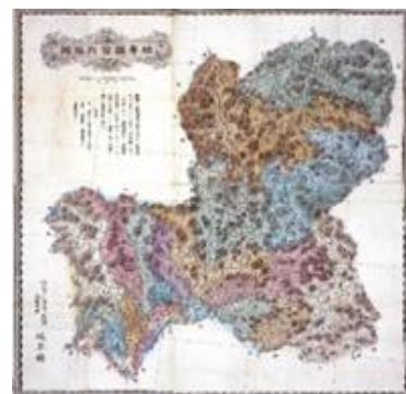
岐阜県管内地図 (所蔵地図より)