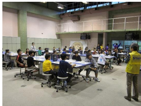
サイエンスワークショップ

サイエンスワールドに来館できない県内の小学校・中学校・特別支援学校向けに、当館職員が学校に出向き、実験ショーや科学実験・工作を行う出前授業です。