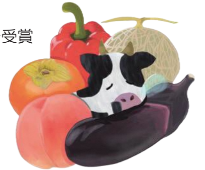
デザイン画：あきそう