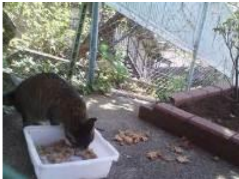
餌場（●●さん宅 庭の一角）