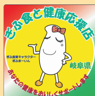
ぎふ食と健康応援店