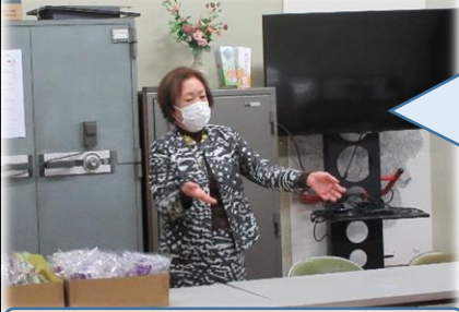
経験に基づいた素敵なお話し

この日は、「コサージュ作り」「給食試食会」「食に関わる講話」「閉級式」と内容が盛りだくさんでした。最初の活動「コサージュ作り」を中心に、学級の様子を紹介します。