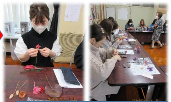
黙々と手を動かしておられます。