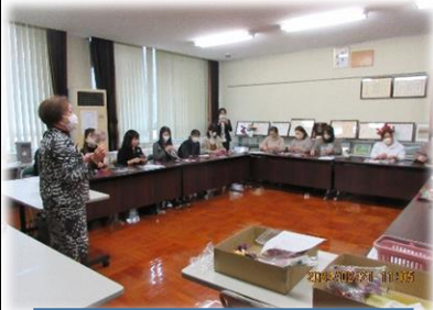
さあ、始めましょう。

司会：副学級長さん 挨拶：学級長さん 学び合って知識を深めましょう。 交流しながら楽しく進めましょう。