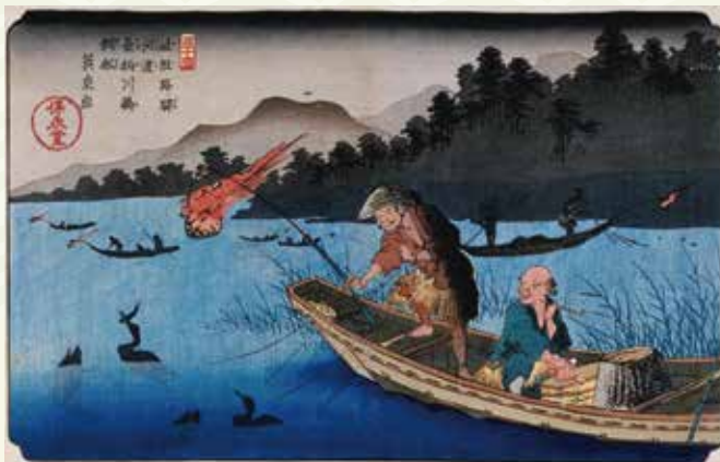
深斎英泉 岐阻路ノ駈河渡長柄川鶴飼船 岐阜県博物館蔵