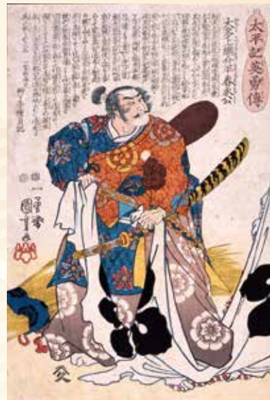
歌川国芳 太平記英勇伝 大多上総介平春永公 岐阜県博物館蔵

現在の岐阜県にあたる飛騨や美濃は、「飛山濃水」といわれる豊かな自然に恵まれた名所や木曾街道を中心とした宿場町が描かれるほか、織田信長や豊臣秀吉など岐阜の歴史に関わりのある武将も芝居絵・武者絵に描かれ人々に親しまれてきました。今回は、岐阜県博物館の所蔵する作品の展示をとおして浮世絵に描かれた多様な岐阜（飛騨・美濃）の魅力を紹介します。