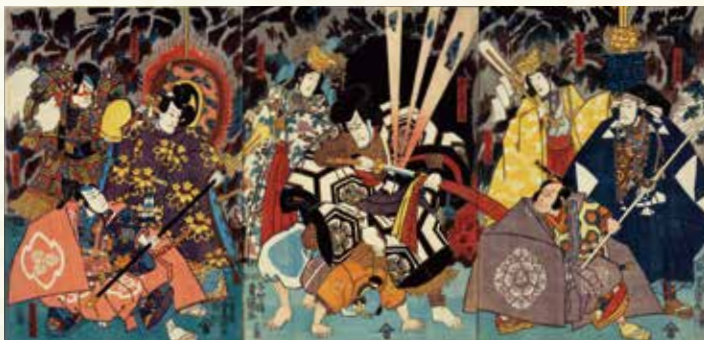
三代歌川豊国 難有御江戸景清 岐阜県博物館蔵