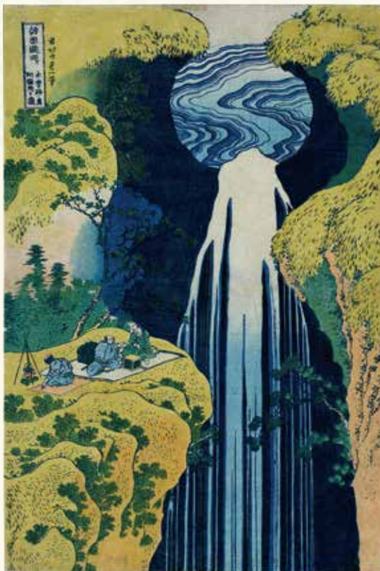
葛飾北斎 諸国瀧廻り木曾路ノ奥阿弥陀ヶ瀧 岐阜県博物館蔵