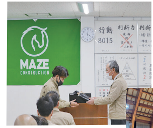
ウォーキングチャレンジ表彰